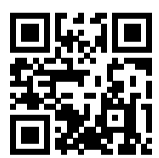
Ersatzhaltestelle alle anderen Linien